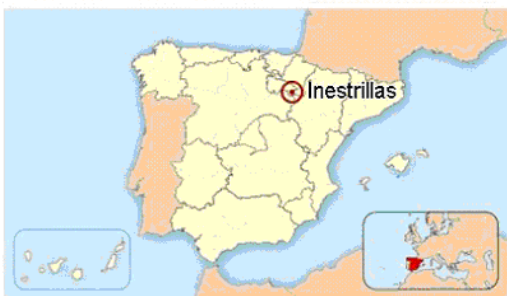
Ubicación de Inestrillas en España.