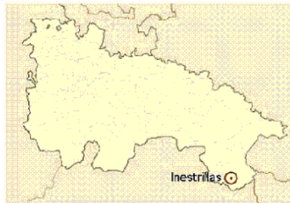
Ubicación de Inestrillas en La Rioja.