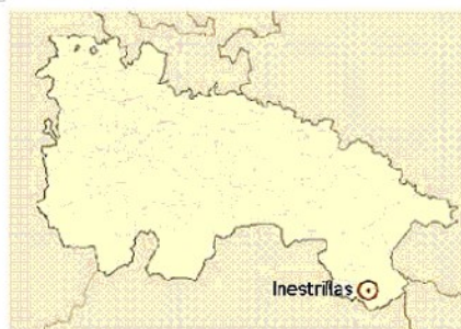
Ubicación de Inestrillas en La Rioja.