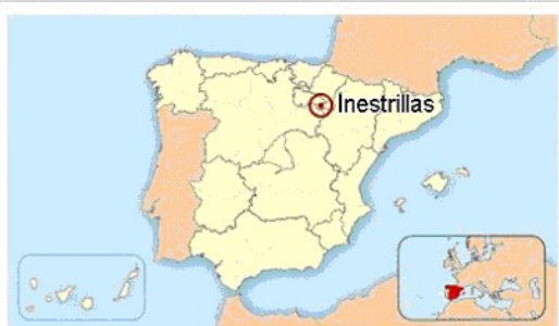
Ubicación de Inestrillas en España.